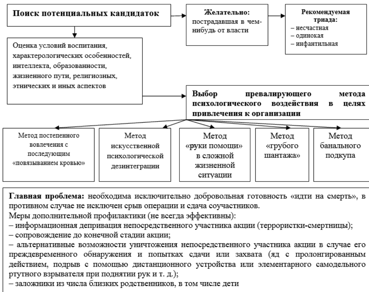
Рис. 2. Система и методы вербовки потенциальных террористок

Подчеркнем важность знаний о методах вовлечения женщин в терроризм именно для пенитенциарных психологов, так как они определяют содержание и формы дальнейшей психокоррекционной работы, ориентированной на исправление [10; 12]. Отметим, что, благодаря полученным в ходе научно-исследовательской работы данным по итогам изучения практики пенитенциарной психологической деятельности с данной категорией исследованы система и методы вербовки террористок.