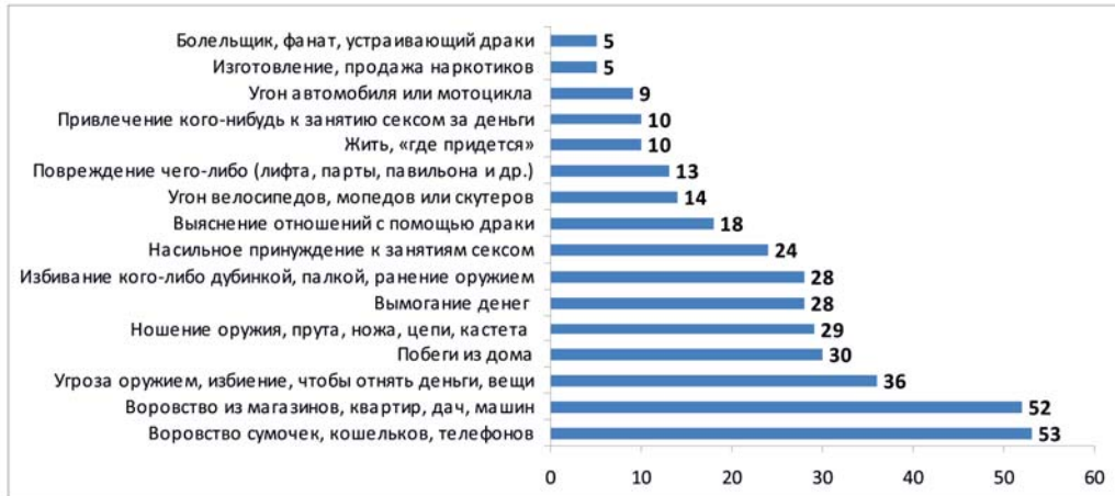
Рис. 1. Перечень противоправных действий несовершеннолетних, отбывающих лишение свободы, до их попадания в воспитательную колонию, % от числа респондентов

с мамой и отчимом); в неполных семьях – 35 %. Эти данные говорят о том, что хотя неполные семьи относятся к группе риска по причинам большей вероятности материального неблагополучия и загруженности единственного родителя на работе, основное внимание следует уделять социально-психологическому климату в семье.