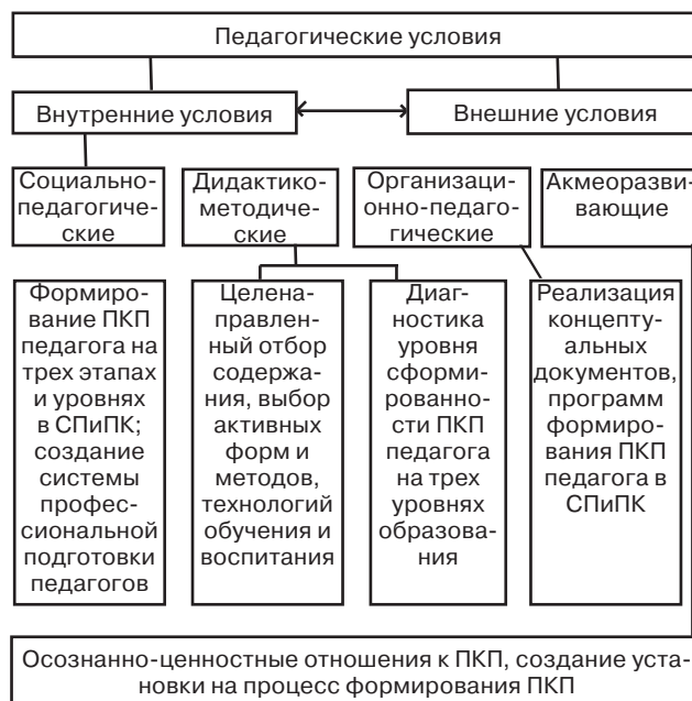
Рис. 2. Педагогические условия формирования профессиональной культуры педагога в СПиПК

Внешние социально-педагогические условия заключаются в устранении несоответствия между требованиями общества к конкурентоспособному педагогу и реальными возможностями системы непрерывного педагогического образования подготовить такого педагога. Как подсистема общественно-экономических условий функционирования и развития образовательного процесса они предполагают повышение социального статуса работников образования, увеличение финансирования учебного процесса и научных исследований, повышение заботы государства о конкурентоспособности педагога на рынке труда, наличие инновационной среды в образовательных учреждениях, обеспечивающей саморазвитие и самосовершенствование педагогов и обучаемых, формирование профессиональной культуры педагога в системе непрерывного педагогического образования на довузовском, вузовском и послевузовском уровнях образования, создание системы профессиональной подготовки педагогов.